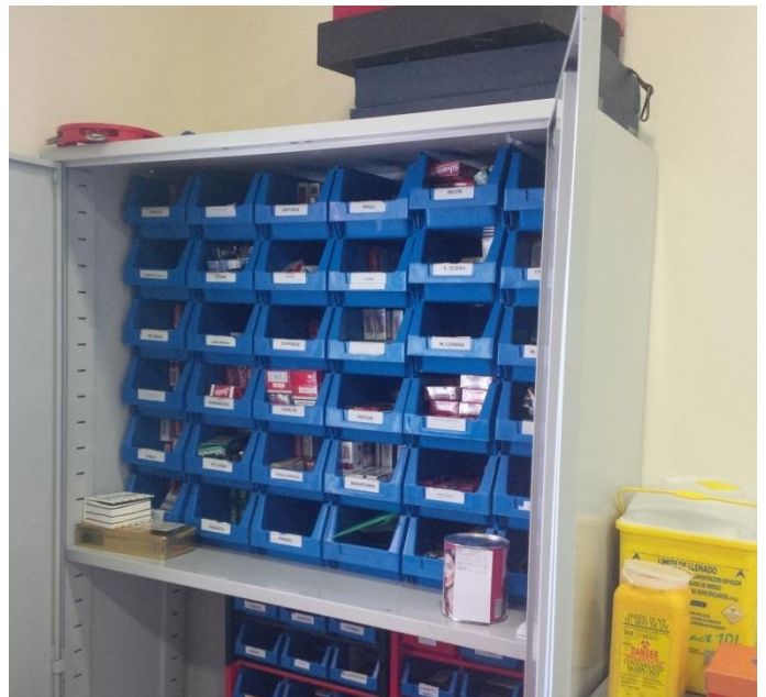
Savarankiško gyvenimo namų gyventojų asmeninių daiktų lentynos