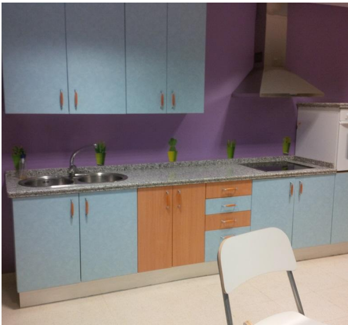
Savarankiško gyvenimo namų virtuvė – mėgstama gyventojų vieta

Specialistų komanda lankėsi Rezidencija Fundacijon Indras - savarankiško gyvenimo namuose psichikos negalią turintiems asmenims. Indras padalinys yra įsikūręs Toro mieste, Zamoros provincijoje. Savarankiško gyvenimo namuose gyvena apie 40 asmenų, kuriems teikiamos reikiamos socialinės paslaugos ir priežiūra, jiems sukuriant panašias į namų aplinką sąlygas. Savarankiško gyvenimo namuose yra įrengta ir mokymo klasė su virtuvės įranga, kurioje siekiant didesnio klientų savarankiškumo jie mokomi gaminti maistą, tvarkytis. Taigi, pagrindinis šių savarankiško gyvenimo namų tikslas yra suteikti negalią turintiems asmenims socialinę paramą ir priežiūrą bei ugdyti jų socialinį savarankiškumą, higienos, buitinius, darbinius įgūdžius. Džiugu, jog Lietuvoje jau irgi veikia panašios įstaigos – Vilniuje įsikūrę savarankiško gyvenimo namai „Savi namai“, skirti psichikos negalią turintiems asmenims, sudarant jiems sąlygas savarankiškai tvarkytis savo asmeninį (šeimos) gyvenimą.