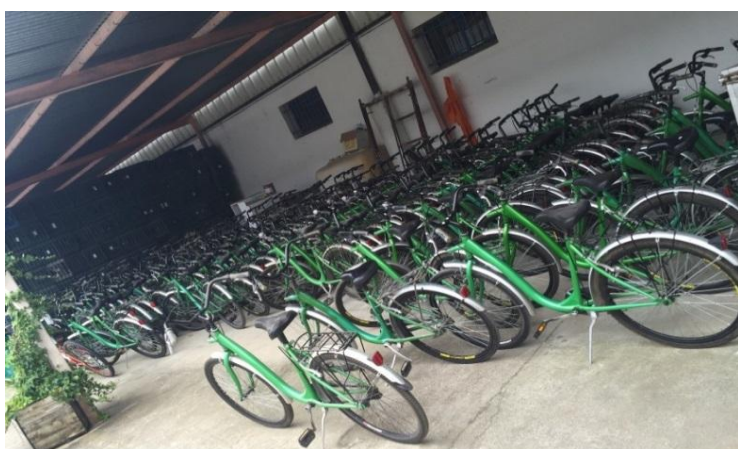
Socialinės įmonės „Artmo Bene“ dviračių remonto dirbtuvės

Antrąją vizito dieną savo patirtimi dalinosi socialinės įmonės „ Artmo Bene “ specialus įdarbinimo centras. Tai Zamoros provincijoje įsikūręs INTRAS padalinys, besirūpinantis neįgaliųjų integracija į darbo rinką. „Artmo bene“, savo vykdoma veikla siekia dvejopų tikslų – sunkią psichikos negalią turinčių asmenų paruošimo darbo rinkai ir verslo vystymo. Centro darbuotojai pristatydami veiklą pabrėžė, kad kiekvienas gautas užsakymas ar pasirašyta sutartis – tai naujos darbo vietos sunkią negalią turintiems asmenims kūrimas. Centras veikia kaip verslo įmonė, kurios tikslas vystyti verslą ir gauti pelną. Kita vertus, visas gautas pelnas investuojamas į tolimesnį veiklos tobulinimą, vystymą ir papildomų darbo vietų steigimą. „Artmo bene“ siūlo vietinei bendruomenei įvairių paslaugų spektrą – tai aplinkos tvarkymas, sodininkystė, dviračių priežiūra ir taisymas, grafinis dizainas, pakavimas ir pan. Vykdamas verslo užsakymus yra sukuriama aplinka, kurioje sunkią negalią turintys asmenys turi galimybę tiek ugdyti trūkstamus bendruosius ir specifinius darbinis gebėjimus, tiek įsidarbinti apsaugotose darbo vietose. Pavyzdžiui, įmonė yra sudariusi sutartį su vietos savivaldybe dėl dviračių taisymo. Ši veikla ne tik keičia visuomenės požiūrį į dirbančius neįgaliuosius, bet ir sukuria darbo vietas sunkią psichikos negalią turintiems asmenims.