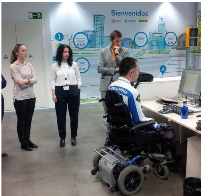
ILUNION įstaigos pristatymas