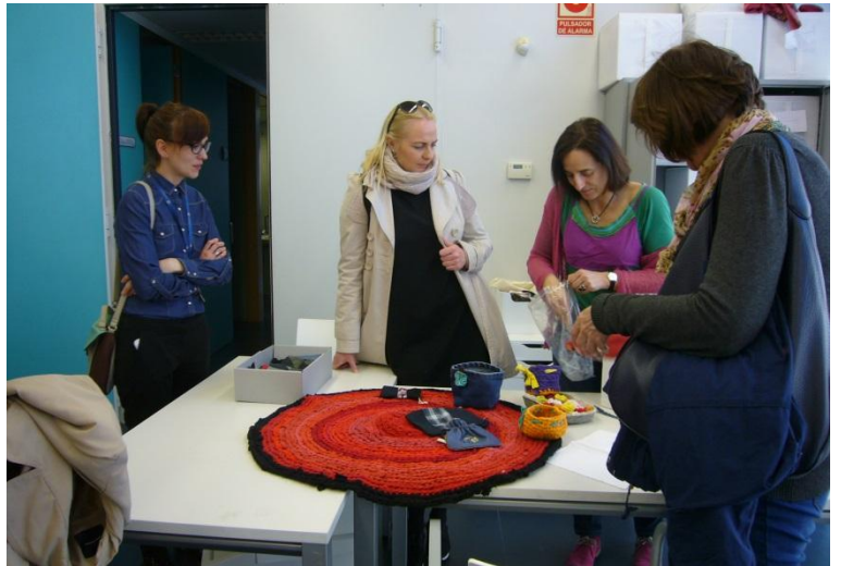
Siuvimo iš antrinių medžiagų dirbtuvės

Specialistų komanda lankėsi Rezidencija Fundacijon Indras - savarankiško gyvenimo namuose psichikos negalią turintiems asmenims. Indras padalinys yra įsikūręs Toro mieste, Zamoros provincijoje. Savarankiško gyvenimo namuose gyvena apie 40 asmenų, kuriems teikiamos reikiamos socialinės paslaugos ir priežiūra, jiems sukuriant panašias į namų aplinką sąlygas. Savarankiško gyvenimo namuose yra įrengta ir mokymo klasė su virtuvės įranga, kurioje siekiant didesnio klientų savarankiškumo jie mokomi gaminti maistą, tvarkytis. Taigi, pagrindinis šių savarankiško gyvenimo namų tikslas yra suteikti negalią turintiems asmenims socialinę paramą ir priežiūrą bei ugdyti jų socialinį savarankiškumą, higienos, buitinius, darbinius įgūdžius. Džiugu, jog Lietuvoje jau irgi veikia panašios įstaigos – Vilniuje įsikūrę savarankiško gyvenimo namai „Savi namai“, skirti psichikos negalią turintiems asmenims, sudarant jiems sąlygas savarankiškai tvarkytis savo asmeninį (šeimos) gyvenimą.