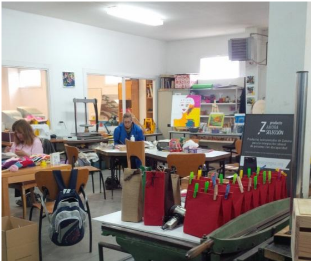
„Artmo Bene“ pakavimo dirbtuvės