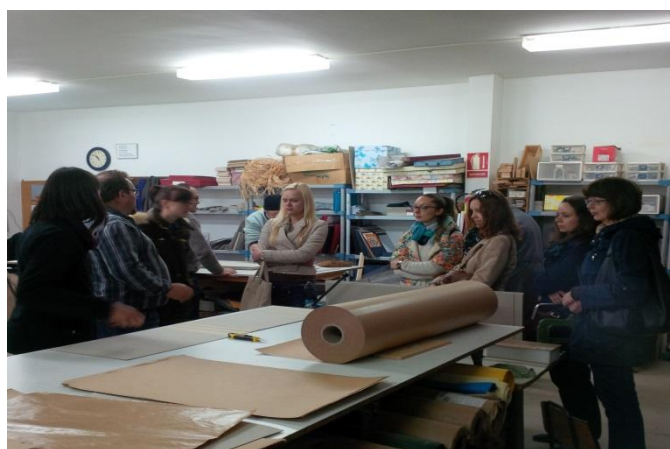
„Artmo Bene“ grafinio dizaino dirbtuvės